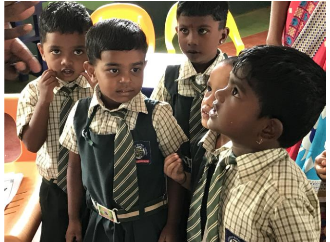
Fotos: Compartir con los alumnos.

Me apasiona dar clase. Compartir con los alumnos. Me llena el corazón la sonrisa y la alegría que despierta el agradecimiento sincero de los niños y jóvenes. Es decir, ellos mismos son mi fuente de inspiración y de pasión por la educación.