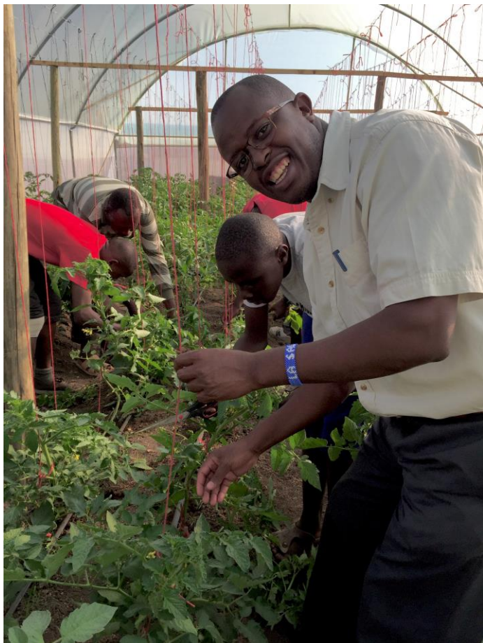
Foto: educación agropecuaria en Kenia.

Ya sea educación formal o informal, en escuela básica o superior, siempre hay espacio para la creatividad y para conectar a las personas basadas en lo más puramente humano.