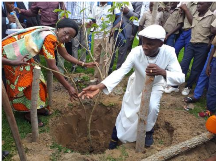
Photo : Plantation et arrosage d'arbres.

l'environnement ; et (4) Former une génération des citoyens du monde. En d'autres termes, il s'agit d'introduire, par de petits actes et gestes d'assainissement de notre cadre de vie, nos 70.000 apprenants dans une nouvelle civilisation, celle du Respect et de la Sauvegarde de notre Environnement ; de leur faire prendre conscience de ce qu'ils sont co-créateurs et de les aider à devenir à la fois des gardiens et des jardiniers de la Création.