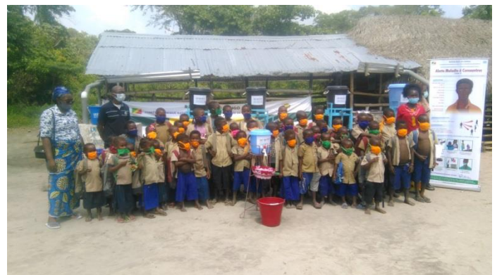
Photo : Visite d'une école des élèves autochtones et dotation de stations de lavage des mains et de masques.